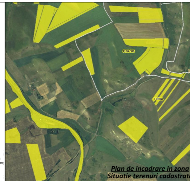
Plan de incadrare in zona Situatie terenuri cadastrate

Data: iunie. 2019 Scara: 1 : 1000 Faza: P.U.Z.